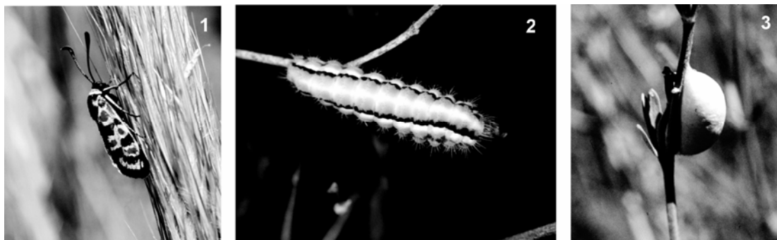
Fig. 1. Imago de Z. occitanica del sureste ibérico. Fig. 2. Oruga adulta de Z. occitanica . Fig. 3. Capullo de Z. occitanica . Fig. 1. Imagoes of Z. occitanica from the southeast of Iberian Peninsula. Fig. 2. Adult caterpillar of Z. occitanica . Fig. 3. Cocoon of Z. occitanica .

Los trabajos referidos a los parasitoides de la Península Ibérica son aun más escasos, aunque los hay valiosos, p. ej. el del húngaro Szepliget, referente al descubrimiento, en los alrededores de Granada, del ichneumonido Litrognatus hispanicus (Szepliget, 1916) en Zygaena sp.; otro de Gonzalo Ceballos (1923) sobre este mismo insecto, en ejemplares procedentes de la playa de la Albufera, de Valencia y otro referente al braconido Cotesia geryonis Marshall, en un ejemplar de Adscita ( Adscita ) schmidti (Naufock, 1933), recolectado por Efetov, en Miraflores (Sierra del Guadarrama- Madrid) (en Efetov & Tarmann, 1999).