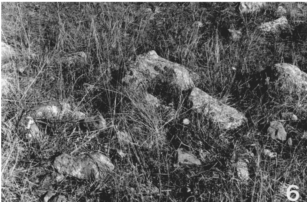
Fig. 6. Hábitat de Lycosa poliostrata (Uruguay, Maldonado, Sierra de las Ánimas).

especimen del ZMB fue utilizado como iotipo según fue definido por D. L. Frizzell (1933: 653) en esta investigación.